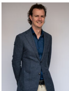
Joost Haman Makelaar o.z.

Als lokale experts kennen wij de regio Leiden van binnen en buiten. U kunt bij ons terecht voor al uw vragen en advies met betrekking tot onroerend goed. Wij zijn een servicegerichte organisatie en ondersteunen u bij elke stap van het transactieproces. Van tips om uw huis verkoopklaar te maken tot aan het verzorgen van een naamplaatje voor de nieuwe eigenaar van uw woning. Onze beroemde slogan luidt: "Niemand in de wereld verkoopt meer onroerend goed dan RE/MAX." Laat ons u overtuigen.